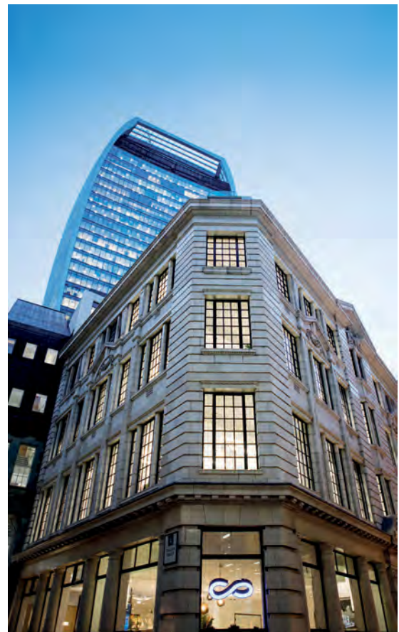
Escritório de Londres/Reino Unido - BREEAM Certificado

Estão autorizados investimentos em títulos verdes emitidos por empresas “best-in-class” na definição acima.