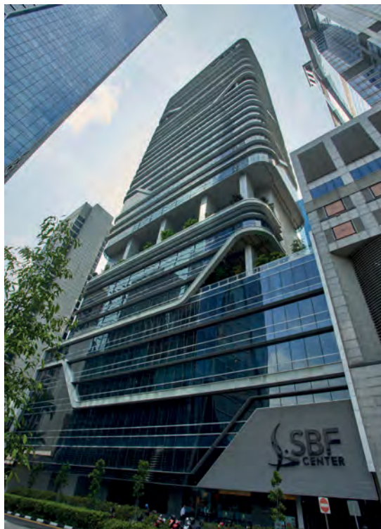
Escritório de Cingapura/Cingapura - Green Platinum certificado

O Grupo também se compromete em participar de grupos de trabalho e iniciativas lideradas por associações profissionais nacionais e internacionais para promover uma melhor compreensão dos temas relacionados à sustentabilidade e uma melhor implementação da sustentabilidade nas decisões de negócios e investimentos.